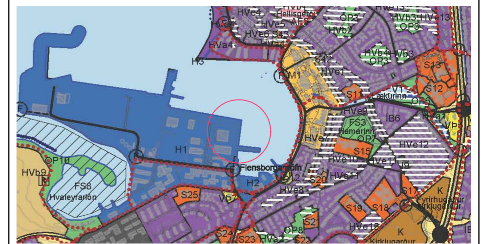
HLUTI AÐALSKIPULAGS HAFNARFJARÐAR 2013-2025